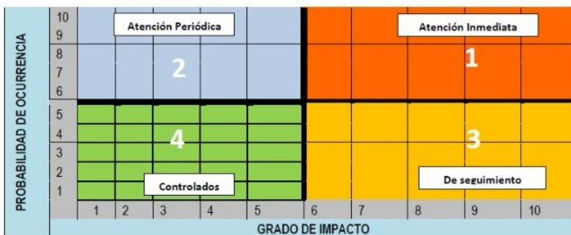
MAPA DE RIESGOS

Existen cuatro tipos de clasificación de los riesgos, que, de acuerdo a la evaluación de su grado de impacto y probabilidad de ocurrencia, son ubicados en diferentes cuadrantes: I de Atención Inmediata, II de Atención Periódica, III de Seguimiento y IV Controlados.